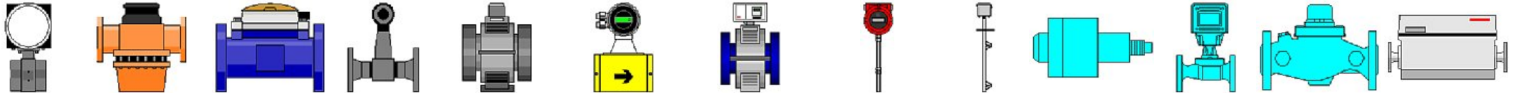
Flowmeter 5 Flowmeter 6 Flowmeter 7 Flowmeter 8 Magnetic flow meter 1 Magnetic flowmeter 2 Magnetic flowmeter 3 Mass flowmeter Multi-point flow meter Simple flow rate controller Simple flowmeter 1 Simple flowmeter 2 Smart coriolis mass flowmeter