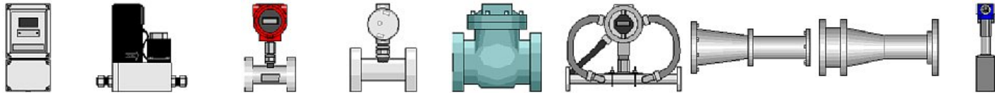
Smart magnetic flowmeter Thermal mass flowmeter Turbine meter 1 Turbine meter 2 Turbine meter 3 Ultrasonic flow transmitter Venturi flow meter 1 Venturi flow meter Vortex meter